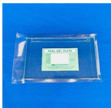
ワイドミニゲルサイズ